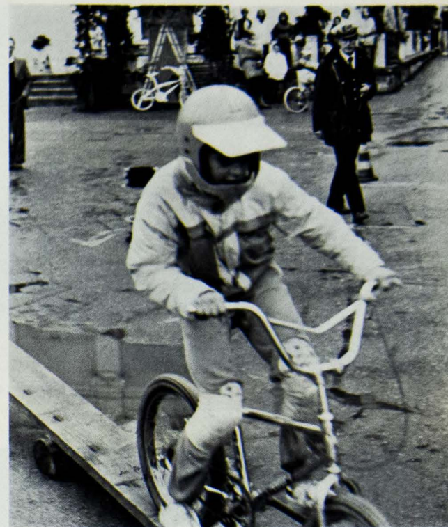
Il vincitore della gimkana B.M.X.

Buon pubblico ad assistere alla lavorazione del latte in piazza ed alla successiva distribuzione di