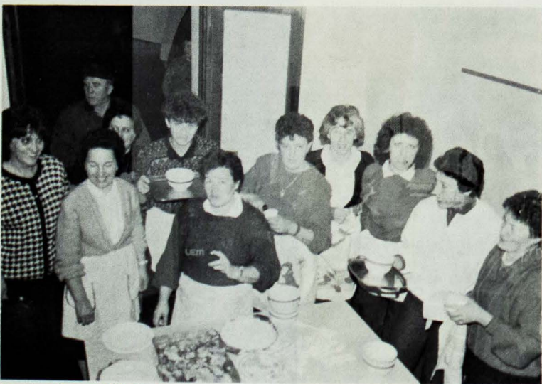
Le cucine soddisfatte

Casualmente, nei giorni che hanno preceduto l'inizio dei festeggiamenti in onore di S. Martino, ho avuto occasione di scambiare delle impressioni con alcune persone a proposito del nutrito programma di quest'anno, preparato appunto per la sagra del patrono della nostra Parrocchia.