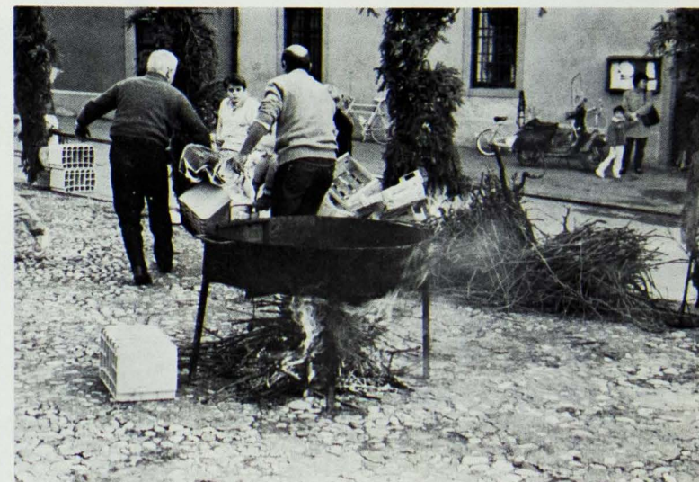
Il padellone delle caldarroste