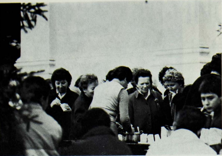
Le signore all'assaggio