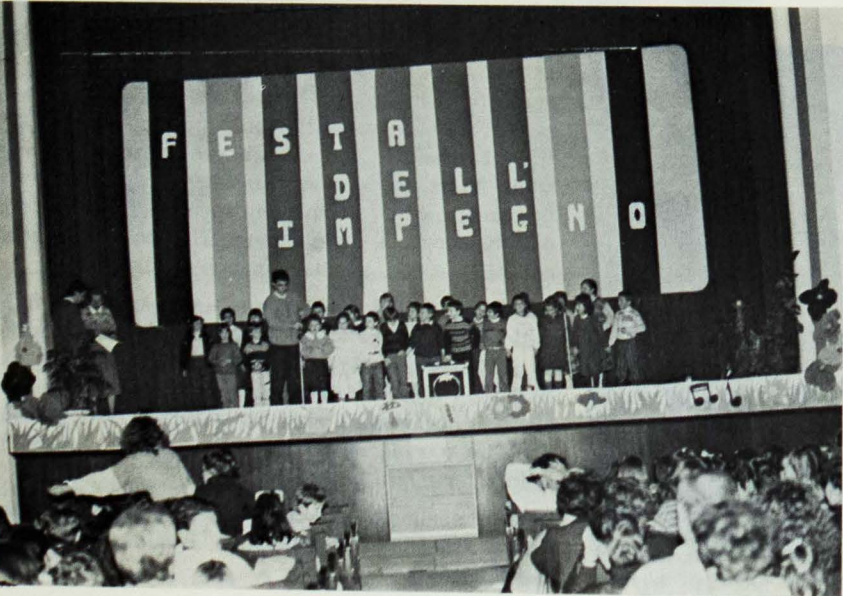
Pomeriggio del 8 dicembre in teatro: i gruppi di A.C. con tanta voglia di fare