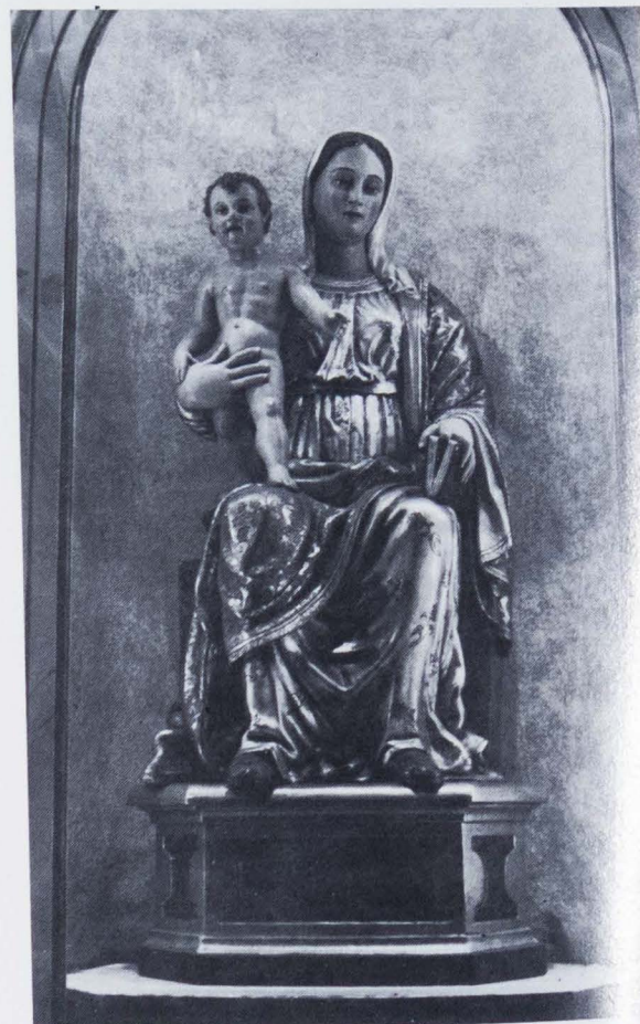
La Madonna di S. Cassiano. Opera fantoniana, recentemente restaurata; collocata definitivamente nella parrocchiale dopo i ripetuti trafugamenti e ritrovamenti.

Mi rivolgo a Cristo, perchè chiami molti giovani e dica loro: VIENI E SEGUIMI. Chiedo ai giovani di non opporsi, di non rispondere: NO! A tutti domando di pregare e di collaborare per le vocazioni. La messa è grande!