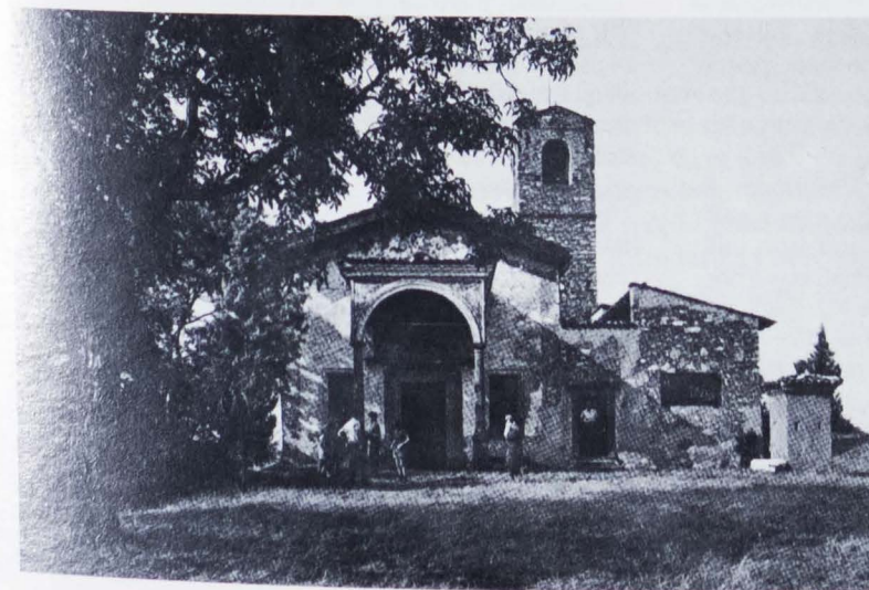
Santuario della Madonna della Rosa a Monticelli Brusati