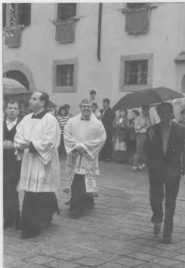
Ingresso a Capo di Ponte: 18/6/1988

Dopo l'ingresso a Capo di Ponte e la sua permanenza di soli quattro anni (troppo brevi) quante iniziative sono state intraprese per un cammino di fede a tutti i livelli! Molti di noi hanno potuto godere dei Suoi progetti. Ricordarne alcuni è importante anche oggi: il