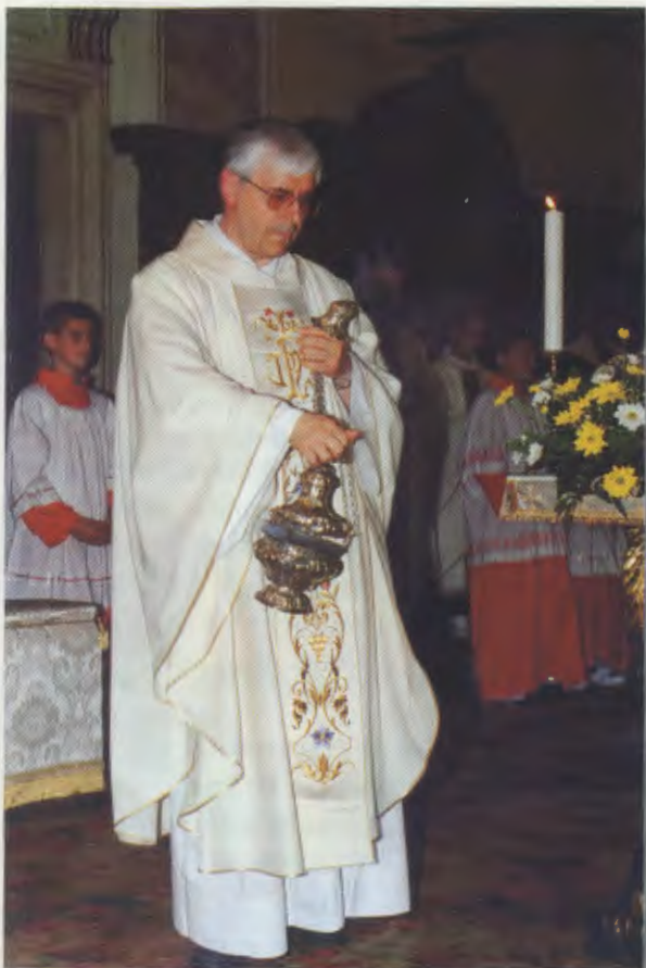
Un momento della Celebrazione Eucaristica del 18/6/2000 a Marone

to a leggere la realtà in cui viviamo per percepire le attese e gli interrogativi, e guidare con mano sicura.