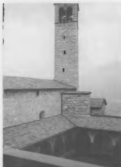
Bienno: Il chiostro dell'Eremo

Con fede, amore e generosità sta ora continuando il Suo ministero nella Parrocchia di Marone sempre in apertura ai bisogni dei suoi parrocchiani.