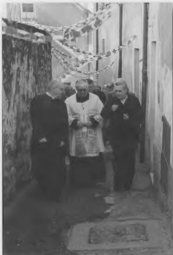
Ingresso a Vello

Certamente la figura del prete è molto cambiata in questi anni, c'è stato un grande evento all'interno della Chiesa, il Concilio Vaticano II, purtroppo ancora disatteso in molta parte delle proposte. Ancora sembra difficile un'ecclesiologia di comunione, ancora la Chiesa si presenta troppo clericale, concentrata intorno alla figura del prete più che a quella della famiglia, piccola chiesa. Eppure nel 1975 i vescovi italiani hanno affermato che il Matrimonio e l'Ordine specificano la comune e fondamentale vocazione battesimale ed insieme contribuiscono all'edificazione del Regno di Dio; anche il Catechismo della Chiesa Cattolica specifica che l'Ordine ed il Matrimonio sono ordinati alla salvezza altrui.