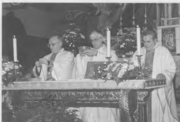
Ingresso a Marone 18/6/2000