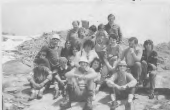
Sopra: con gli adolescenti di Bienna al Blumone 1984. Sotto: - Bienna - Processione a Cristo Re