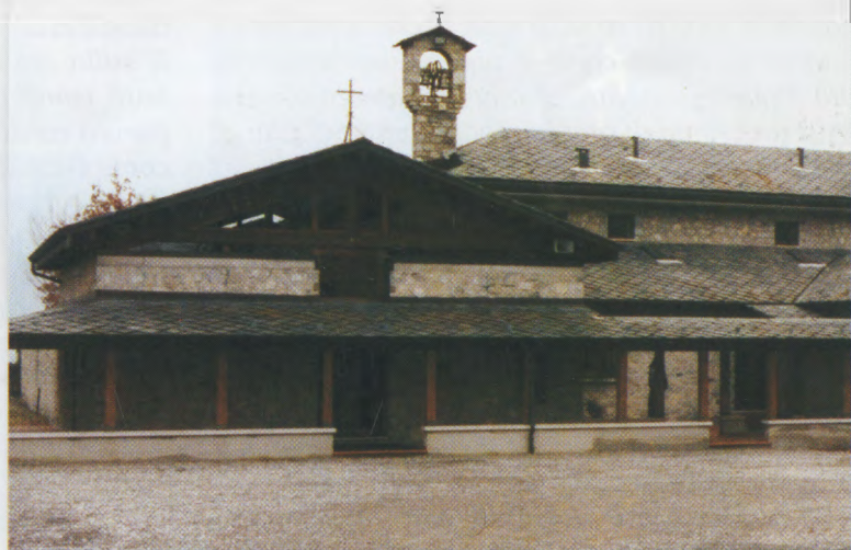
Bienna: Il convento delle Claustrali

Ci piace offrirle ancora una volta una preghiera, che forse ricorderà... una "preghiera-meditazione"... non solo per lei, ma anche per i suoi nuovi parrocchiani di Marone e di Vello, sul senso del Sacerdozio, che è sempre