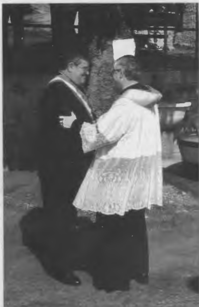
Saluto del Sindaco all'ingresso in Vello 18/6/2000

U n tempo, non poi tanto lontano, Parroco, Sindaco e Medico condotto erano, - per l'autorevolezza che avevano, inscindibilmente legata alle loro fondamentali funzioni - i soggetti ai quali i cittadini facevano riferimento; di volta in volta, a seconda delle occasioni e delle necessità: consiglieri, arbitri, moderatori...; in una parola "maestri" di vita e parenti della convivenza.