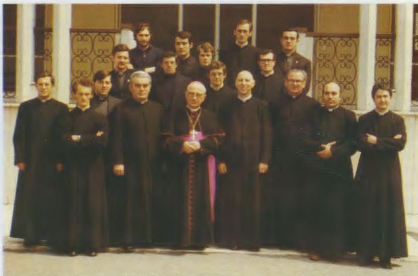
Foto di gruppo degli ordinandi Presbiteri col Vescovo