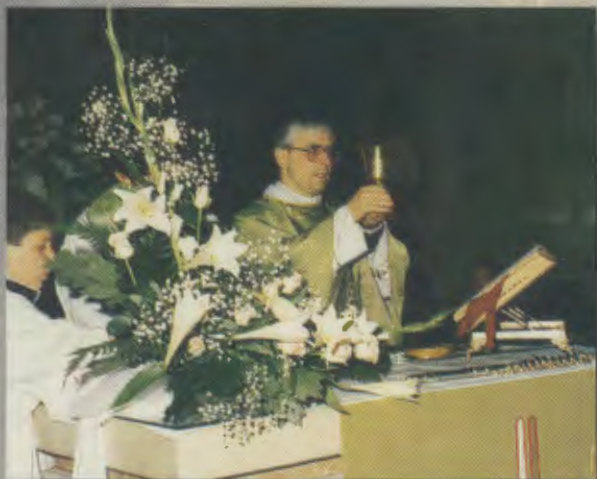
Saluto alla Comunità di Capò di Ponte: 28/6/1992