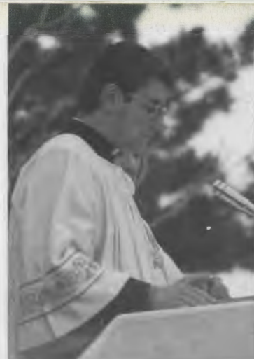
S. Messa al monumento di Cristo Re a Bienna

È stato per noi -adolescenti di 25 anni fa- una figura educativa importante. Vicino e lontano allo stesso tempo, sempre disposto