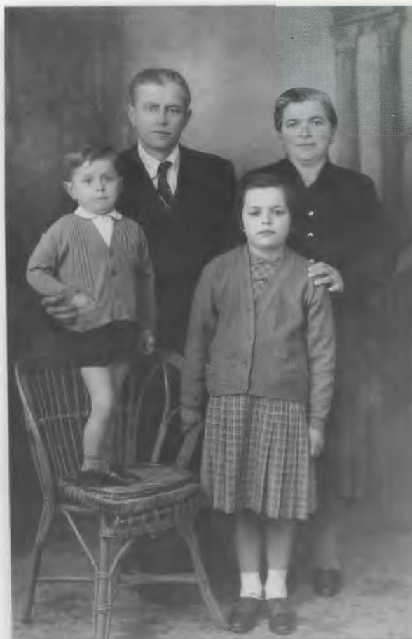
Foto di famiglia 1956

Tutto è nero, eppure si può proclamarlo con parole profetiche: "Nessuno riuscirà a rende-