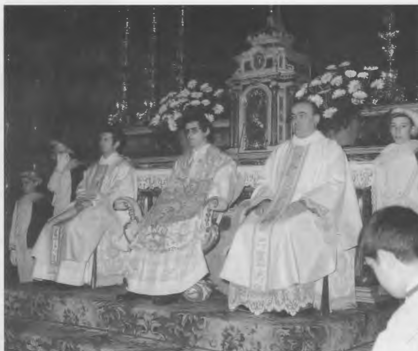
Prima S. Messa a Rovato 12/6/1977

(Tratto da: Bollettino Parrocchiale di Rovato, anno XXXIV - n.6-7 Giugno-Luglio 1977)