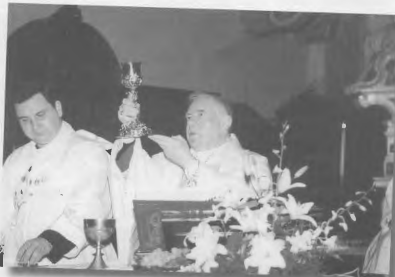
Il Vescovo in visita Pastorale a Marone nel 2003

Circa questo rapporto tra l'Eucaristia e la vita di ogni giorno, Benedetto XVI sottolinea che l'Eucaristia non è soltanto un mistero da credere e da celebrare; è pure un mistero da vivere, perché la vita del cristiano assuma sempre più la "forma eucaristica". L'Eucaristia richiede e rende possibile, giorno dopo giorno, la progressiva trasfigurazione della propria esistenza, così che il culto gradito a Dio non venga relegato soltanto ad un momento particolare della settimana, ma tenda a identificarsi con ogni aspetto della vita - anche familiare, professionale e sociale - in quanto vissuto dentro il rapporto con Cristo e come offerta a Dio e