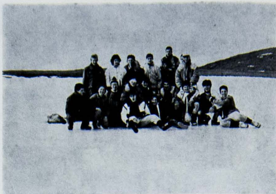
Dcm. 3 Gennaio: Foto di Gruppo sul Laghetto del Guglielmo