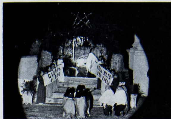
24 Dic.: Presepio Vivente, Adorazione di Angeli e Pastori

Inutile continuare la narrazione di un momento