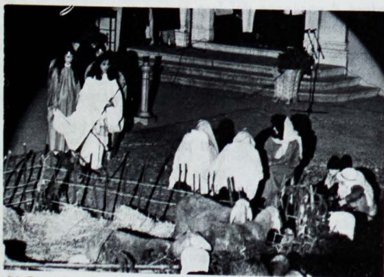
24 Dic.: Presepio Vivente, Annuncio ai Pastori

Proprio così, da quattro chiacchiere al bar, è nata