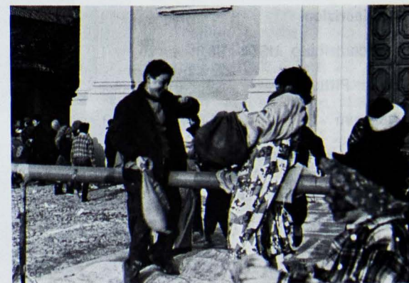
16 Febr.: Carnevale - Sfida in Piazza tra le Contrade

Si temeva un ridotto concorso di popolo, invece Martedì pomeriggio all'asilo la ciurma delle maschere, manco a dirlo, era al gran completo. Approfittando dell'impunità generale in quel giorno, mi accolgono con manganelli, spruzzi e schiume: in men che non si dica sono conciato per le feste, è come se fossi mascherato. Non mi resta che recitare la parte dello scemo alla guida di un'armata di folli: sul ritmo samba e il testo demenziale di Cacao Meraviglioso, sfiliamo per le vie del Centro fino alla piazza, dove ci accolgono con ovazioni, fischi e altre botte. Strombazzando in un megafono che funziona a intermittenza, cerco con gli altri educatori di formare improbabili squadre di contrada; per dare inizio al Torneo 'Contrade senza frontiere' c'è da sbracciarsi a tener giù dal sagrato la gente che terrà impegnati i ragazzi per un'ora e mezzo in giochi buffi che appassionano anche i grandi. Il pomeriggio è limpido, persino mite, ma un po' di thè o cioccolata calda con due frittelle non guastano, specie se le offre l'Oratorio; intanto il Pregasso continua a vincere ogni manche fino a strappare la Maschera d'Oro che riporterà in contrada a far bella mostra di sé per tutto l'anno.