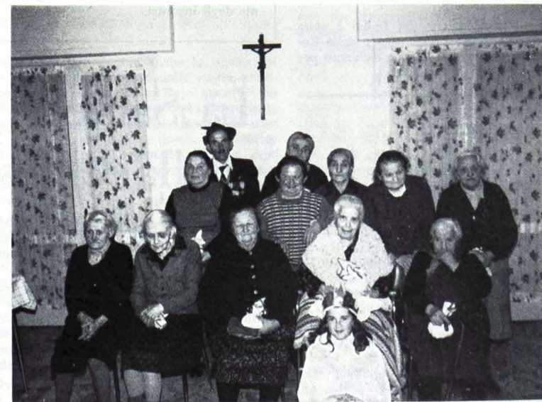
Festa di S. Lucia tra gli anziani ospiti di Villa Serena